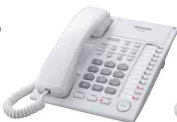
■ KX-T7720 Unidad con Altavoz