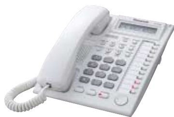
■ KX-T7730 Unidad con LCD y Altavoz