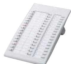
■ KX-T7740 Consola DSS